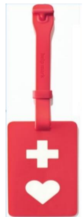
ストラップ型ヘルプマーク

ヘルプカード・マークの配布窓口 ○各市町村窓口 ○県庁障害者支援室 ○県地域振興局 ○県支庁・事務所 ○ハートピアかごしま